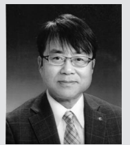
宮城県美容業生活衛生同業組合