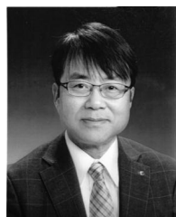
宮城県美容業生活衛生同業組合