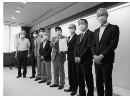
〈宮城県知事への要望 (遠藤副知事対応)〉

宮城県理容生活衛生同業組合及び宮城県美容業生活衛生同業組合、クリーニング生活衛生同業組合は、いづれも県民の生活に不可欠なサービスを提供しており、公衆衛生の向上に寄与するため努めてまいりました。今年度に入り、感染力が更に強いとされる変異型ウイルス(N501Y)による新型コロナウイルス感染症がその勢いを増し、相次いで『緊急事態宣言』、『まん延防止等対象地域』である区域が拡大されるなど、全国的に感染が急拡大する中、私ども組合としても強い危機感を持っております。